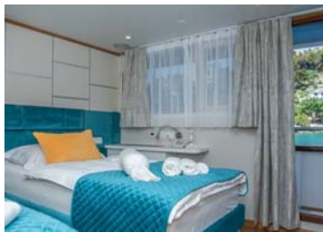
Cabine Deluxe Sabord